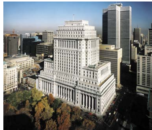
Édifice Sun Life : Catégorie Édifice historique