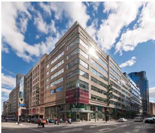
Complexe Les Ailes : Catégorie Centres Commerciaux